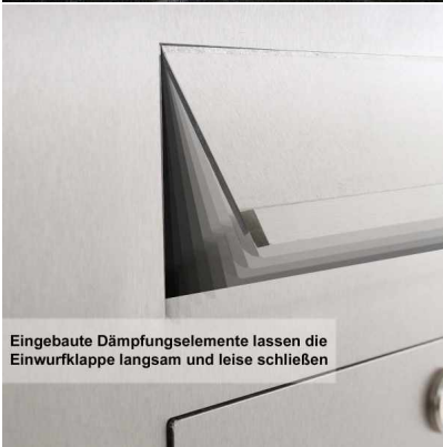
Eingebaute Dämpfungselemente lassen die Einwurflappe langsam und leise schließen